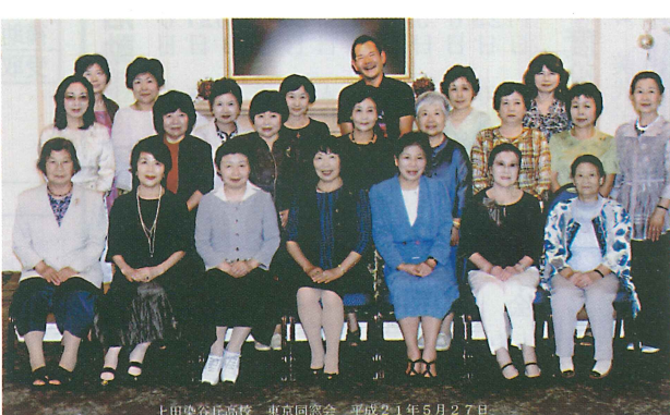
上田染谷丘高校 東京同窓会 平成21年5月27日

ルコ各地で演奏 2011年2月18日 現代邦楽作曲家連盟作品演奏会において自作品を発表(四ッ谷区民センターホール)