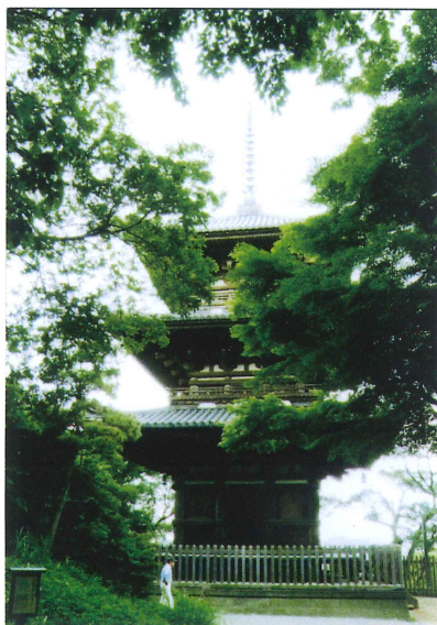
昨年の同窓会・三溪園にて同窓生撮影

○JR、東武東上線、西武池袋線、東京メトロ有楽町線・丸の内線 池袋駅西口より徒歩3分