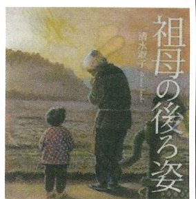
こと、伝えていきたことを書きましたところ、

昭和三十三年三月、暖かい日の卒業式でした。通学はほとんど下駄履きでした。神科村大久保から行きは早足で三十分、帰りは上り坂なので四十分。舗装されていない道路を車にハネを飛ばされながら、雨の日も雪の日も歩いて通いました。授業は選択科目だったので、古い木造校舎のうぐいす張りの廊下は、教室への移動で満員。民族の大移動と呼んでいました。クラス一同顔を合せるのはホームルームだけでした。学友会長をさせてもらった時に、「学友会誌創刊号」を発行しました。懐かしい思い出でいっぱいです。