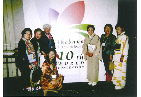
いけばなインターナショナルの各国の方々 左から二人目

花展では作品の説明はしません、見る人が各々感じて頂いたらと思います。振り返って、冒頭の叔母の質問は、彼女に感動を与えられなかつたのかと大いに反省しました。追記 現在いけばなインターナショナル(1955年創設 本都東京)に所属し、伝統文化のい