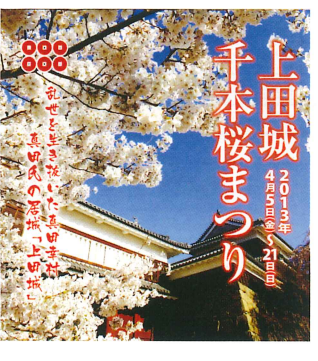
上田城 4月10日〜5月21日 千本桜まつり

尚、年会費1,000円をお送りいただき、ありがとうございます。大切に使用させていただきます。