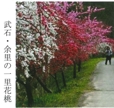
武石・余里の一里花桃