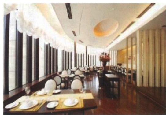
5F レストランフォレスト山荘

そんな活動の傍ら、近くの小学校で読み聞かせのボランティアで命の大切さにつながるような本を子供たちに読んでいます。家では好きなお花をいじったり、また生花・アーティフィシャルフラワーアレンジを教えて頂いたり、コンサートに行ったり、車好きの主人と旅したり...元気で楽しく日々過ごせていることに感謝です。 でも年齢を考えるともうすぐ八十才!! びっくりですが、近いうちに同級会ができますよう頑張ります。そんなキツカケを頂いてありがとうございます。 この欄は会員の皆様のページです。どうか近況報告等お寄せください。