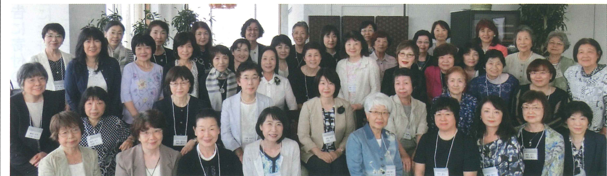
←2019 関東同窓会総会の集合写真です。 後列の皆様、見えにくくて申し訳ありません。