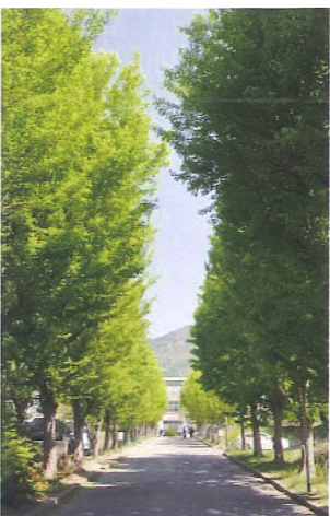
正門のトウカエデ並木