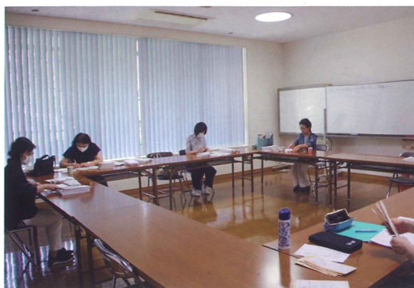
▲2020年8月会報発送作業