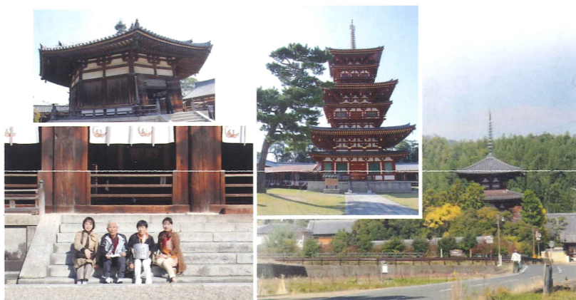
二年前恩師西村先生と二回目の修学旅行を計画同級生有志と実行しました。先生は今年卒寿を迎えられました。

活動には、コロナ禍にも関わらず関東同窓会員の皆様にもご協力いただきありがとうございます。お蔭様で、机や空調等の母校の教育環境整備に着手できました。同窓会館空調設備更新等のためにも、募金活動は続けておりますので、尚一層のご協力を賜りたいと存じます。コロナが収まり、関東同窓会員の皆様にお会いできる日を、待ち望んでおります。